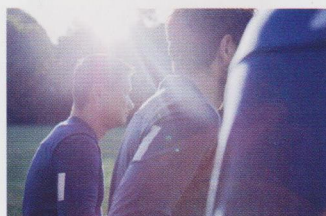
Sport, mode et design, Emyun