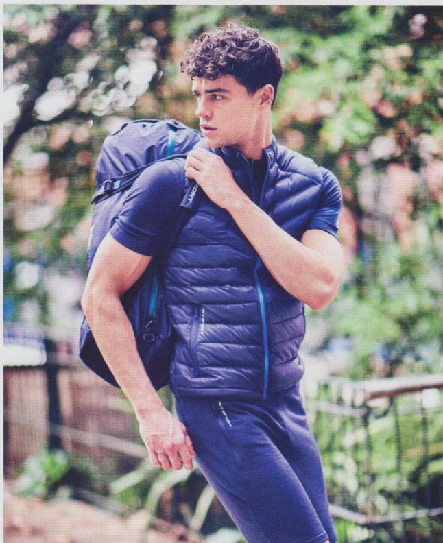
Hackett signe une collection spécialement pour les coureurs.