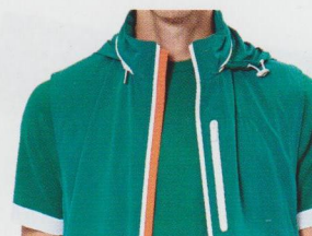
Sport en Ville, Hermès