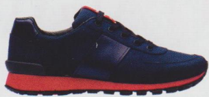
Sneakers en cuir et tissu technique, Prada